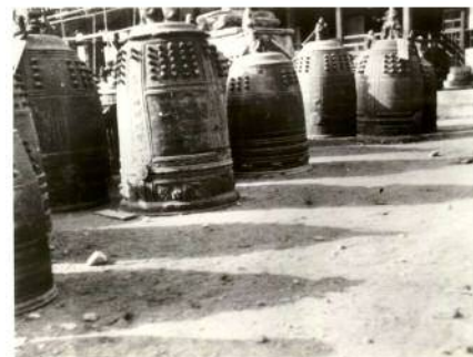
寺の境内に集められた梵鐘 高橋秀吉コレクション