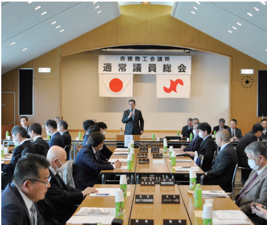
第144回通常議員総会