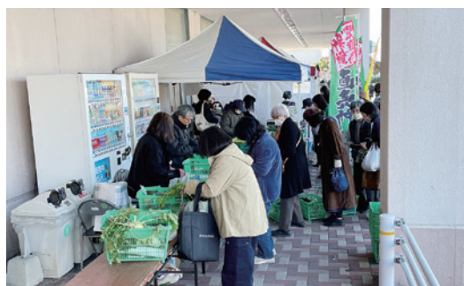
店外スペースの様子

良い交流の場となりました。当日は多くのお客様にご来場いただき、買い物や交流を楽しんでいただきました。今後も地域の事業者と連携し、経済活性化に貢献していきます。