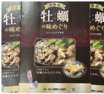
赤穂産牡蠣の味めぐり冊子

赤穂市外・兵庫県外からの交流人口を増やす目的で、赤穂の冬の味覚「牡蠣」料理を提供す