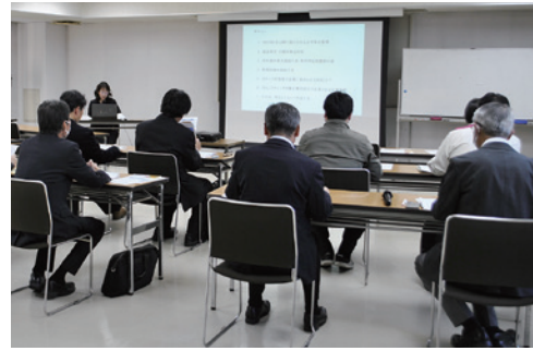
労務研究会の様子

によって対応が異なっておりますのでご注意ください。 プレゼント企画では、店頭POPから二次元コードを読み取って、アンケートに回答すると応募できる抽選企画を行っており、合計で30名様に牡蠣のセットをプレゼントします。(応募期間：令和8年2月28日まで) 詳細については左記のお問い合わせか、HPを御覧下さい。