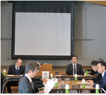
第 271 回常議員会