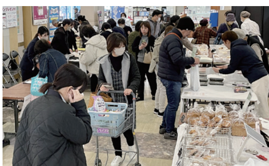
店内セントラルコートの様子