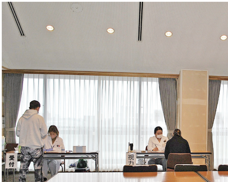
今年も多くの方が受診されました