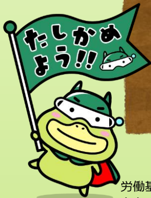
労働基準局広報キャラクタ ー たしかめたん

兵庫県（地域別）最低賃金は、 職種・年齢に関わらず、パート、 アルバイトの方を含むすべての 労働者に適用されるルールです。