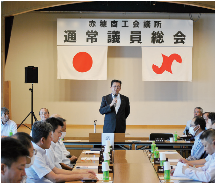
第 141 回通常議員総会