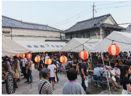
多くの家族連れで賑わった奥藤商事の中庭