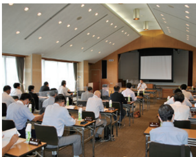
議員協議会にて3号議員を選任