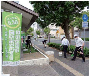
備前日生信用金庫