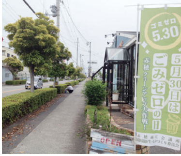
(株)セルビーハウジング

本年度は新型コロナウイルスの影響により、中心市街地の清掃は中止とし、各事業所で周辺地域の清掃を行って頂きました。希望される事業所には事前にタスキとのほりを配布し、17事業所から193名と、過去最多の参加人数となりました。赤穂クリーンアップ大作戦にご協力頂いた事業所の皆様ありがとうございました。一部参加事業所の清掃活動の様子をご紹介します。