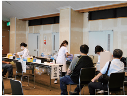
マスクを着用のもと実施

当所では6月10日、13日の2日間、赤穂商工会館にて会員事業所を対象とした健康診断を実施