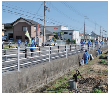
(株)横山サポートテック