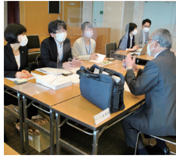
情報交換会の様子

当所並びに赤穂経営者協会では、6月6日に赤穂商工会館にて、ハローワーク赤穂との共催で、「ハローワーク赤穂管内