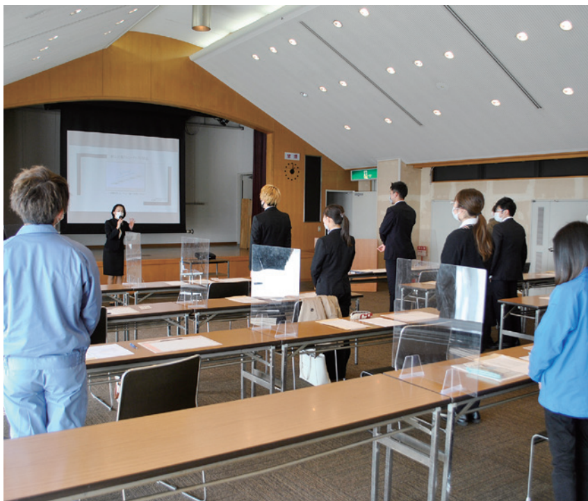
新入社員フォローアップ研修会の様子