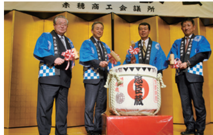
牟礼赤穂市長を迎えての鏡開き

当所では1月28日、赤穂ロイヤルホテルで新春懇談会を開催し、当所役員議員をはじめ、関係機関から77名が出席した。