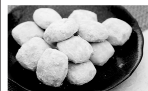
塩クッキー 151円(2個入り)/789円(10個入り)

📍 赤穂市加里屋39-12 ☎ 0791-43-8018 🕒 10:00~18:00 📅 休 元日 🚗 なし※無料のふれあいパークを利用