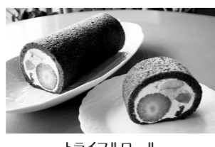
トライフルロール 420円(カット)/2,100円(1本)

📍 赤穂市加里屋中洲5-30 ☎ 0791-43-8678 🕒 7:30~19:00 📅 休 水・木曜 🚗 4台