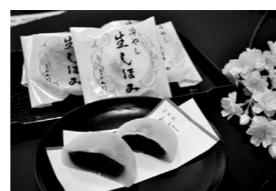
冷やし生しほみ 195円

📍 赤穂市加里屋69-8 ☎ 0791-42-2296 🕒 9:00~19:00 📅 休 日曜 🚗 2台