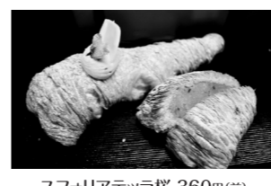
スフォリアテッラ桜 360円(前) アラゴスタ桜 486円(後)

📍 赤穂市御崎341-1 ☎ 0791-42-2024 🕒 8:00~19:00 📅 休 なし 🚗 1台