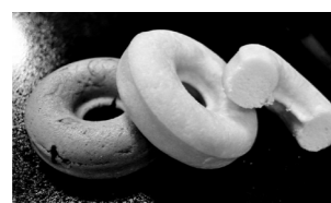
豆腐入り焼きドーナツ 《プレーン》120円/《味付》130円~

📍 赤穂市塩屋4-5 ☎ 0791-42-0267 🕒 8:00~19:00 📅 休 木曜(祝日は営業) 🚗 4台