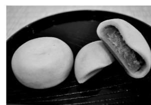
辰治包(たつじつぽ) 105円

📍 赤穂市加里屋65-1 ☎ 0791-45-1212 🕒 9:00~18:00 📅 休 なし 🚗 なし