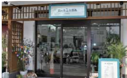
店舗前には鉢植えが並んでいます

Q. 開業したきっかけは？ A. 赤穂市のお店で約10年修行しながら、地元でいつか自分のお店を持ちたいと思って赤穂市で開業しました。