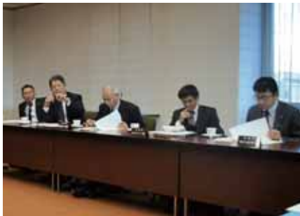
高取峠トンネル化に対する意見交換

12月6日(火)、国道250号高取峠のトンネル化を実現することを目的とした「高取峠ト