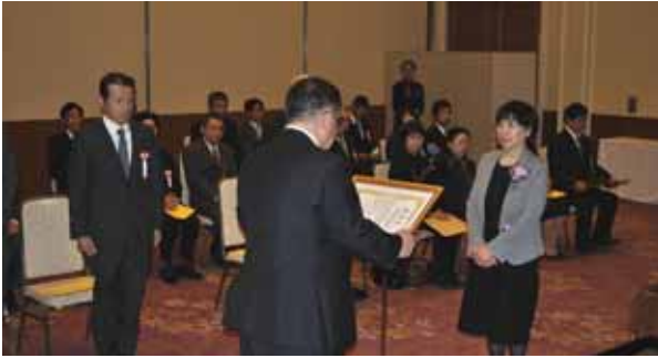
表彰状と記念品が贈られました

これは、当所の会員事業所に永年勤続した従業員の功労に対して表彰を行っているものです。式典では、大木会頭より「これまで培ってきた豊かな知識と経験を十分に活かし、地域経済の牽引役として一層活躍されることをご期待申し上げます」と式辞を述べ、被表彰者38名に表彰状と記念品が贈られました。