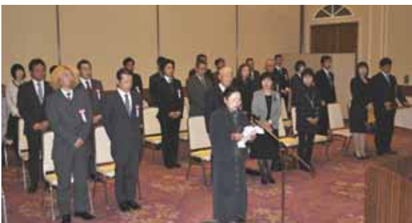
代表謝辞 (資)安部鉄工

式典終了後、昼食会を開催し、表彰を受けられた会社の同僚やご家族の皆様と懇談しました。