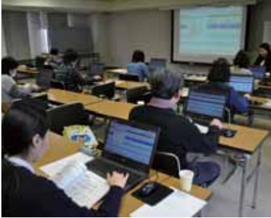
パソコン会計を体験する受講者