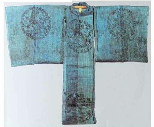
褐衣 鎌倉時代 東寺藏 河合寸翁が復元の参考に

中世の地図、国府の渡し付近を流れる川に『藍染川』『青見川』『むらさき川』など、藍染めをした地区の面影を偲ばせています。