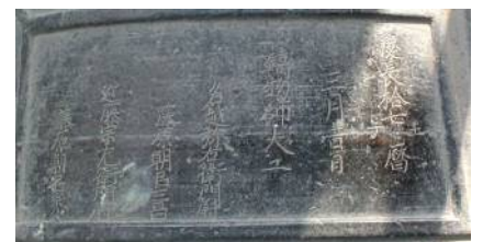
風鐸に刻まれた銘