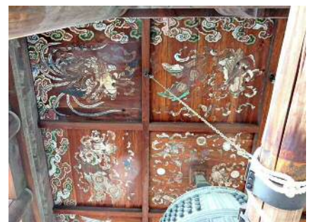
天井に描かれた絵（鐘楼）