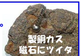
製銅カス 磁石にツイタ