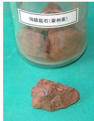
鉄鉱石 オーストラリア産