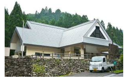
わたらの里学習館

草を敷きて神の座と為しき。故に敷草といふ。此の村に山あり。 南方に去ること十里ばかり、二町ばかりの沢あり。 此の沢に菅生じ、笠に最も好し。檜・杉・栗、黄蓮・黒葛生ふ。 鉄を生ず。狼羆住む。