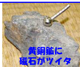
黄銅鉱に 磁石がツイタ