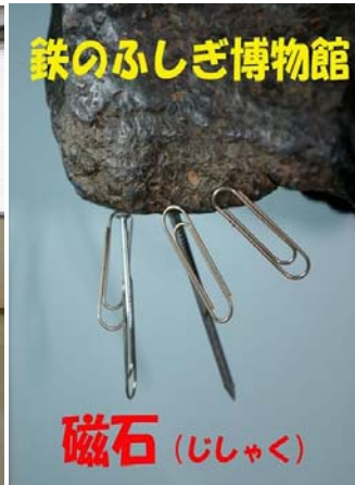
天然磁石 アメリカユタ州産