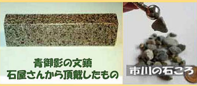
青御影の文鎮 石屋さんから頂戴したもの

写真の石ころは近所の市川の石ころです。関西電力の水力発電所のある大河内でも多くの石ころが磁石につきます。あなたも、近所の河原や海岸で試してみてください。子供達が喜びますよ。