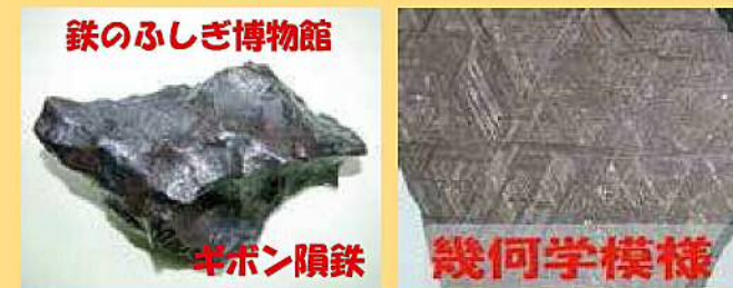
鉄のふしぎ博物館

2007年7月、『ギボン隕鉄』が大・中・小の3個が送られて来ました。これらの隕鉄は私の宝物になり『鉄のふしぎ博物館』に展示しています。