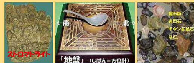
ストロマトライト