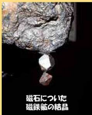
磁石についた 磁鉄鉱の結晶