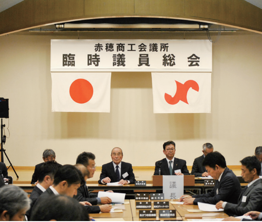
第52回臨時議員総会