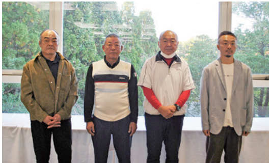
団体戦優勝の(株)平成建設のみなさん