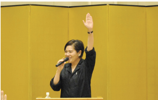
青木さやか氏による特別講演会

赤穂商工会議所 労務対策・ 税務金融委員会では、令和6年 度労働環境対策事業として、4 月24日、赤穂ロイヤルホテルに て新入社員のつどいを開催しま した。18事業所から61名の新入 社員が参加し、歓迎式典、特別 講演会、新入社員研修を行いま