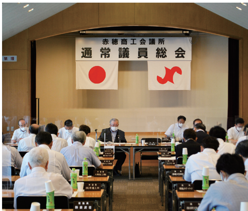
第135回通常議員総会