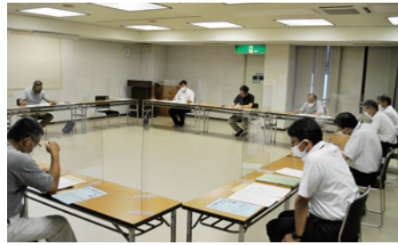
総勢 12 名の参加となりました