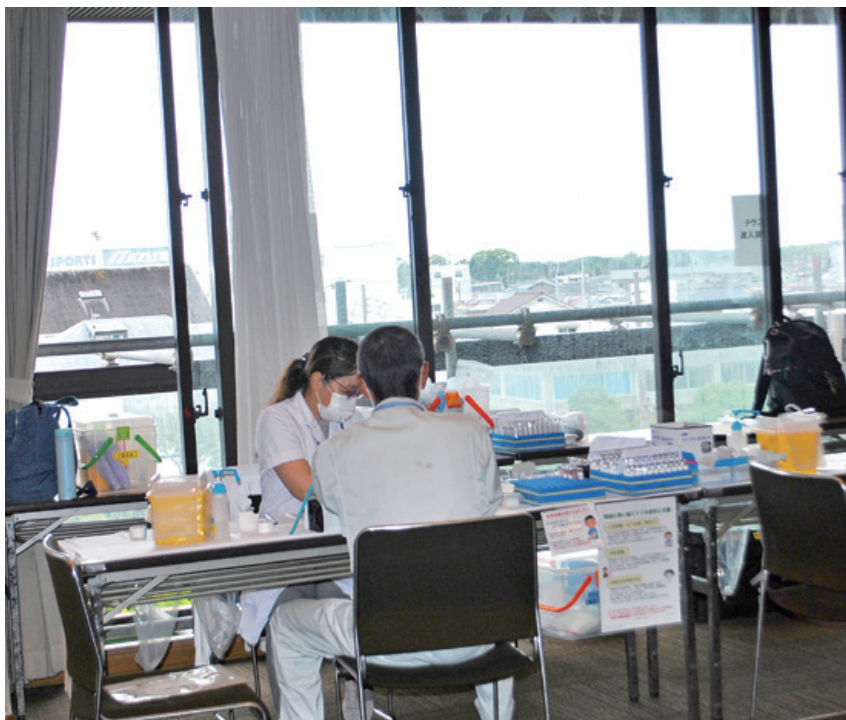
200名以上の方が受診されました