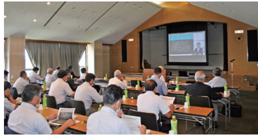
オンデマンドセミナーの様子