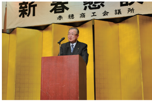
大木会頭あいさつ