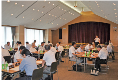
3号議員を選任した議員協議会