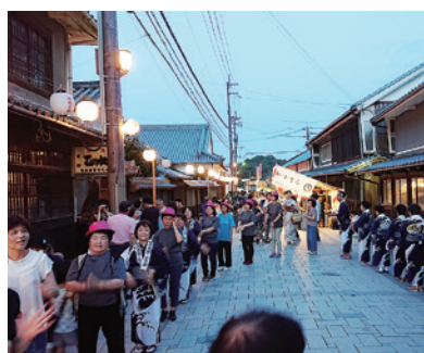
多くの方が盆踊りに参加されました

取締役)・坂越商店会・坂越盆踊り保存会では、8月11日に「第29回いきいき坂越たこ祭り」を開催しました。