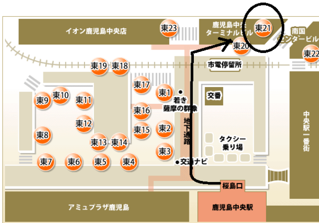
鹿児島中央駅→鹿児島空港 バス時刻表